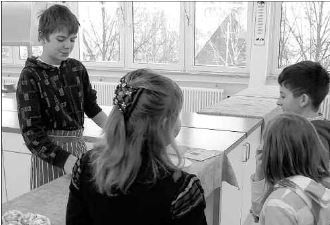
In der modernen und großzügig eingerichteten Lehrküche wurden Kostproben, von Schülerhänden zubereitet, den Besuchern gereicht.