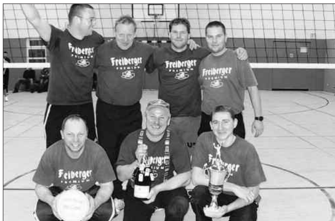
Die Sieger - Feuerwehr Rugiswalde

Wir hoffen, alle Mannschaften auch im nächsten Jahr wieder begrüßen zu dürfen.