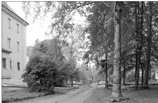
Der Weg zum neuen Haupteingang ist z.T. fertig.

einen behindertengerechten Zugang. Gegenwärtig werden noch verschiedene Leistungen im Erdgeschoss ausgeführt. Die Arbeiten an den Außenanlagen wurden in der 41. KW begonnen werden witterungsbedingt im Frühjahr 2012 fertig gestellt.