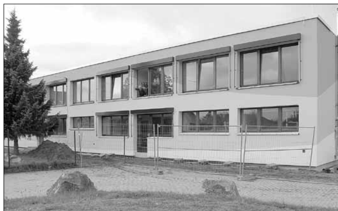
Die Restarbeiten im unteren Sockelbereich wurden zwischenzeitlich abgeschlossen.

einzusparen. Vor allem die neu gestaltete Außenfassade ist für alle sichtbar und die Kinder freuen sich über nun über ihren schönen Kindergarten.