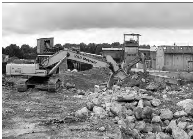
Die Abbrucharbeiten gehen mit Hilfe schwerer Technik zügig voran.