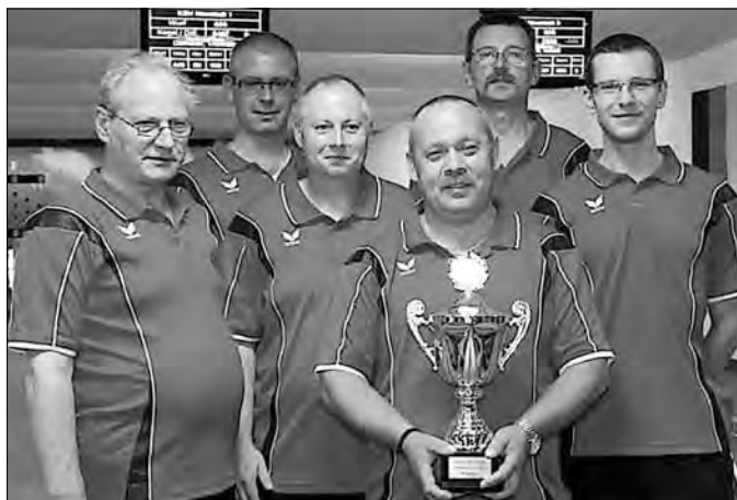
Kreispokalsieger 2011: KSV Neustadt 1.