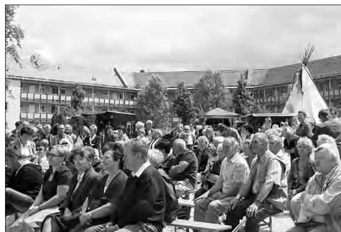
Besucher zur Eröffnung der diesjährigen Wald- und Jagdtage im Schlossgelände.