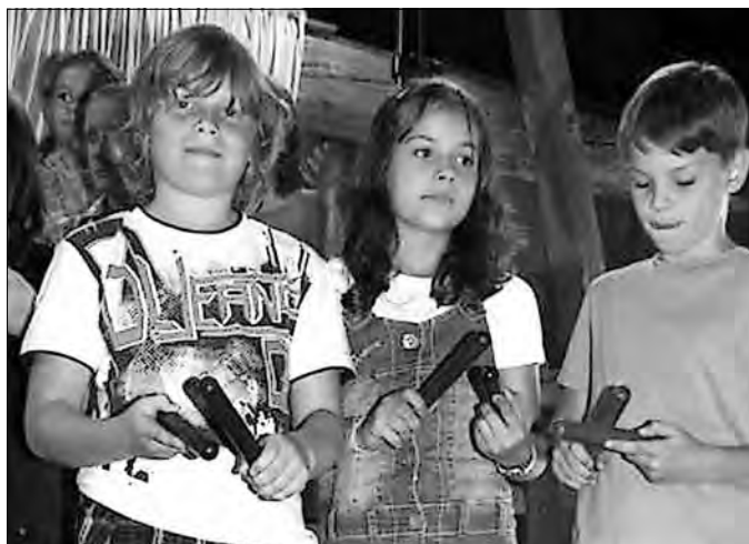
Kinder vom Chor der Julius-Mißbach-Grundschule