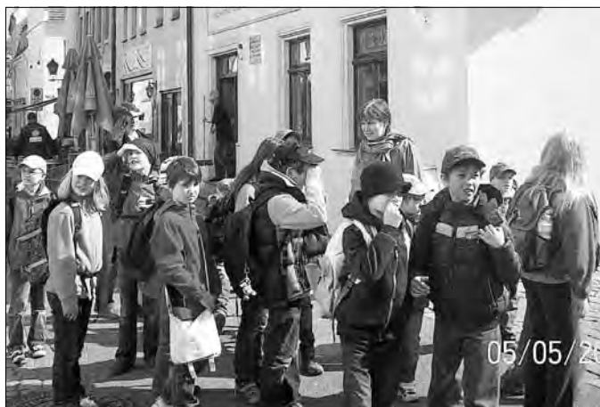
Auf der Dohnaischen Straße am Engelserker