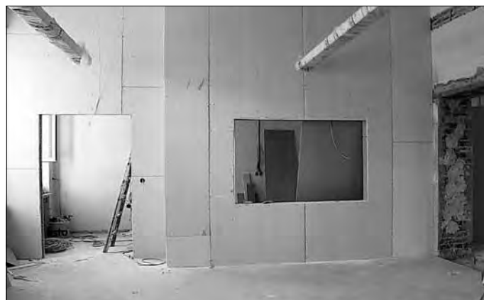
Das wird die neue Essensausgabe im Erdgeschoss, die sich gegenwärtig noch im Rohbau befindet.

Bauarbeiten im Außenbereich der Schule. So wurde die Drainage erneuert und Türöffnungen teilweise verschlossen. Mit Beginn der Sommerferien begannen die Arbeiten im Innenbereich. Das Kellergeschoss bekommt einen neuen Fußboden, die Wände werden verputzt sowie die haustechnischen Anlagen instand ge-