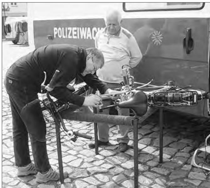
Codierung eines Fahrrades auf dem Neustädter Markt