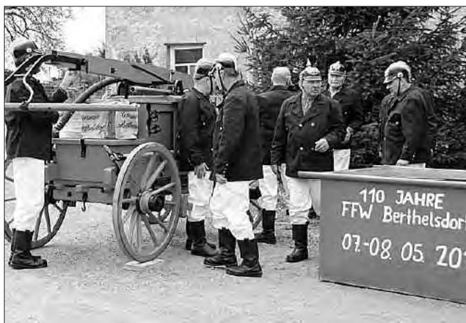
Mitglieder des Feuerwehrvereins demonstrieren die historische Friese-Spritze